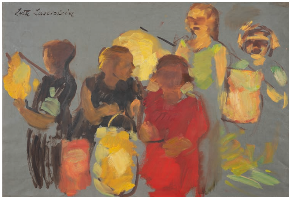
Lotte Laserstein Studie zu „Laternenkinder“, Öl auf blauem Karton, ca. 1933