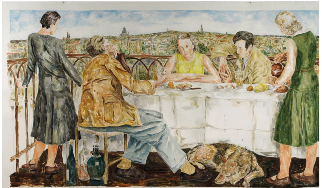
Stefan Pietryga Aquarell nach dem Bild von Lotte Laserstein von 1930 „Abend über Potsdam“, 2015/16, Höhe: 115cm x 218cm